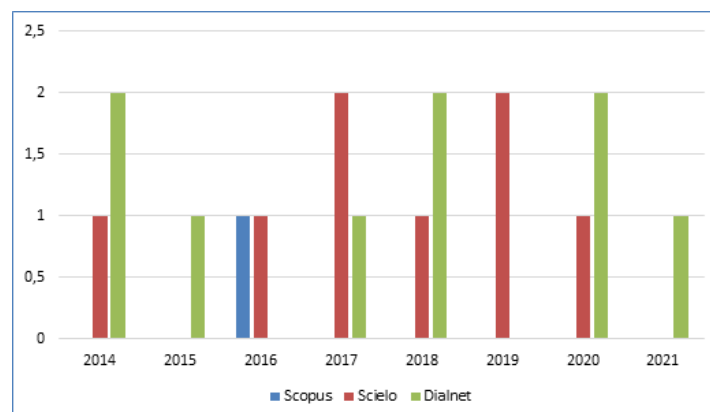
Figura 2: Artículos publicados por año de 2014 a 2021