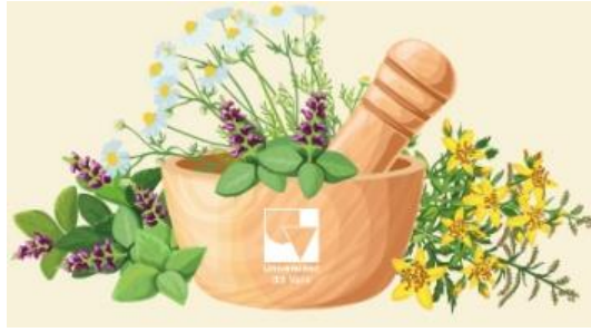
Figura 1. Plantas medicinales