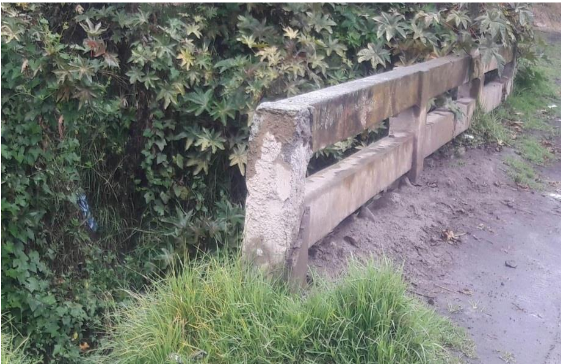
Puente en mal estado.