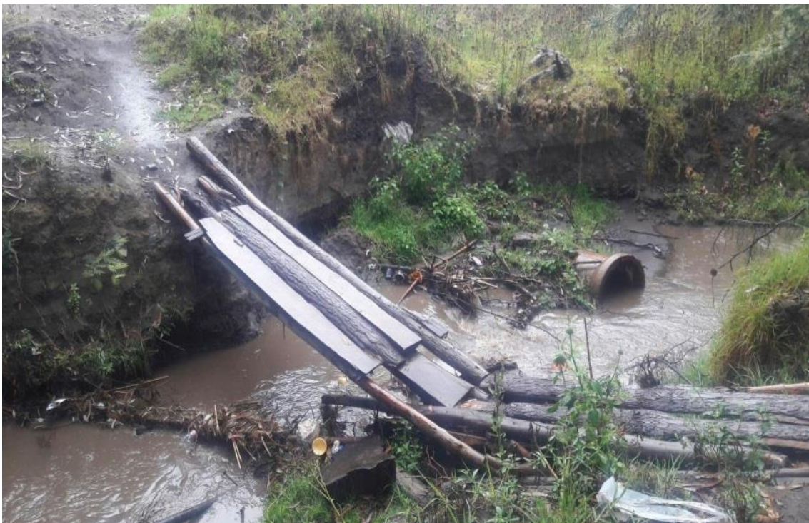
Mal estado de la quebrada Las Abras