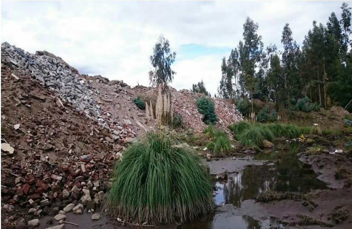
Escombros arrojados a la quebrada Las Abras