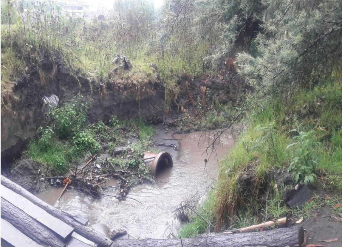
Desperdicios en la quebrada