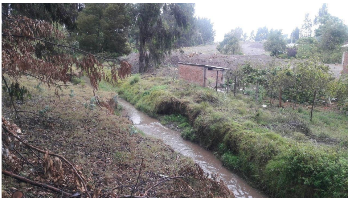
Fuente agua que recorre la quebrada