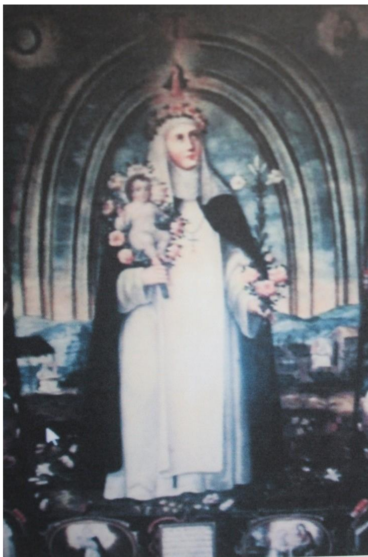
Figura 1: Santa Rosa de Lima, Juan Correa, siglo XVII