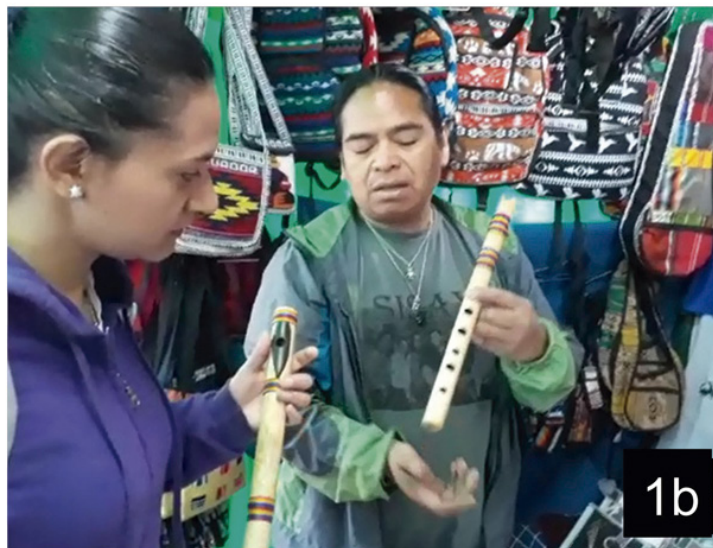
Figura 1: Primeros instrumentos sonoros

Figura 1a. Técnicas Prehispánicas en los Objetos de Concha, podemos ver los diagramas de los orificios cónicos (a) y bicónicos (d)