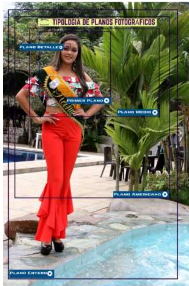
Grafico No 5: Planos Fotográficos