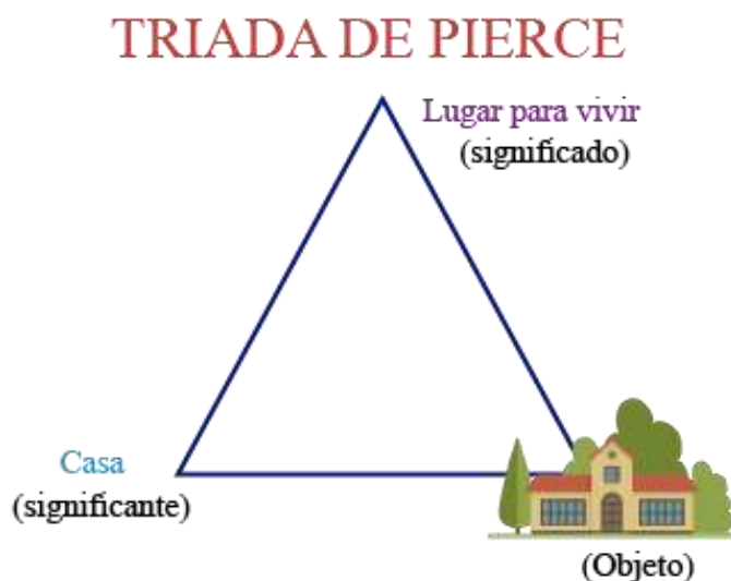
Grafico No 3. La triada de Pierce