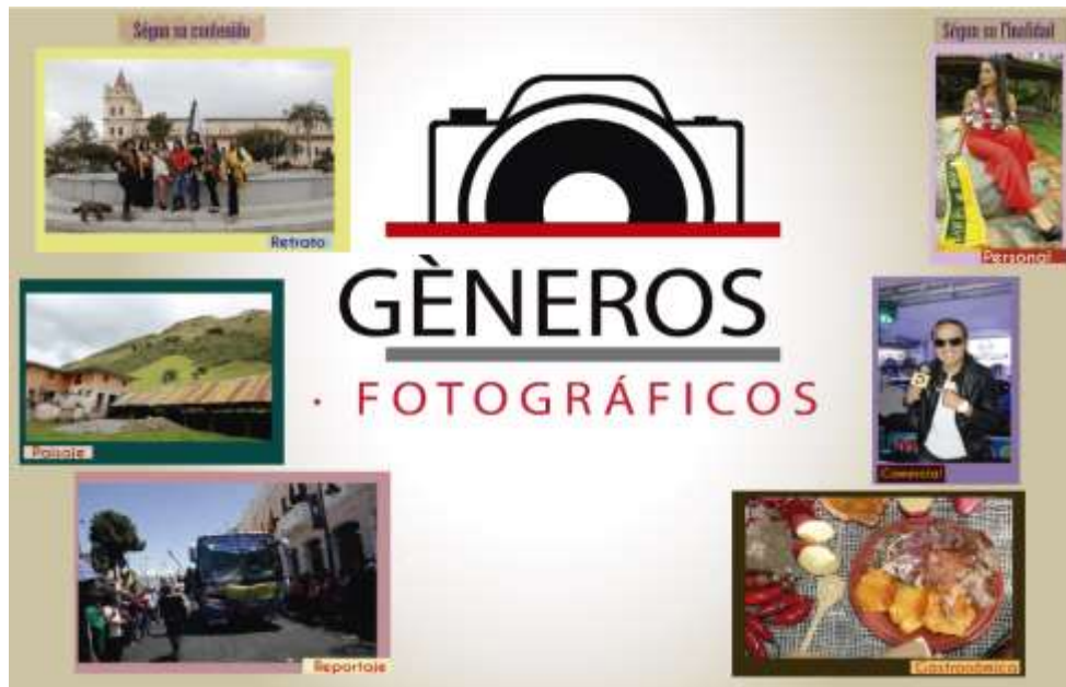
Grafico No 4: Géneros fotográficos