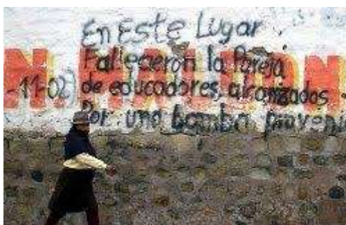
Grafico 2. Muro testigo Polvorín Riobamba

Por lo tanto, la comunicación visual busca la construcción de un proceso de comunicación donde las personas crean conceptos y generan comportamientos en torno a lo que perciben mediante lo visual, es decir, el impacto que provoca una imagen es de suma importancia en la sociedad actual.