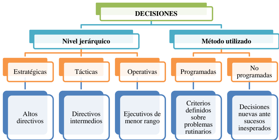
Gráfico 1. Tipos de Decisiones