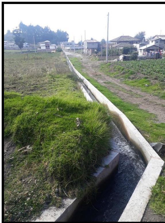
Imagen 2.- Canal principal de agua de regadío que llega a todos los cultivos de la zona.