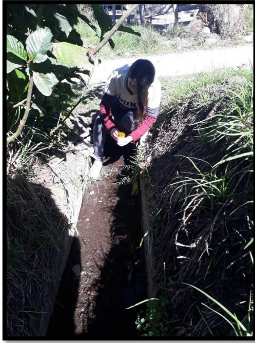
Imagen 3.- Agua estancada de la parroquia.