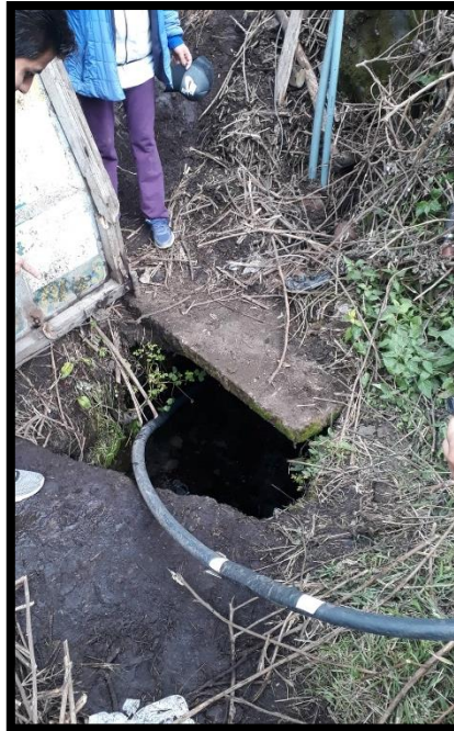
Imagen 1.- Reservorio de agua entubada que abastece a toda la comunidad.

ANEXO N.-2: Agua de regadío, agua entubada y agua estancada de la parroquia de San Andrés.