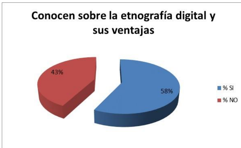
Gráfico N. 9 Ventajas de la Etnografía digital