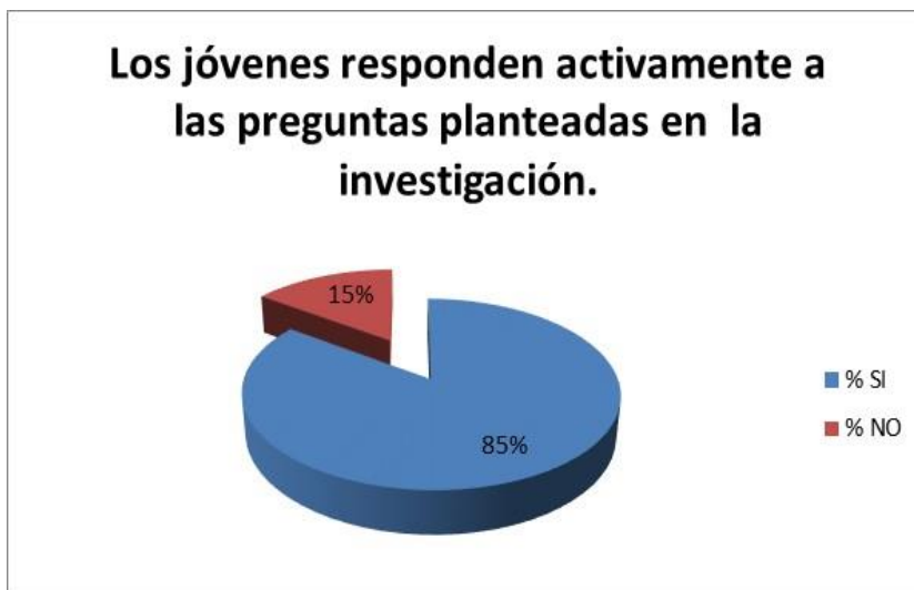
Gráfico N. 1 Respuesta activa a planteamiento de preguntas

En esta parte se presenta los resultados obtenidos de acuerdo con lo observado sobre la etnografía digital y su estudio en la juventud indígena en la comunidad de Machángara perteneciente a la parroquia de Cacha después del análisis del trabajo de campo que se realizo