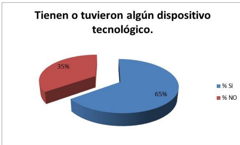
Gráfico N. 3 Uso de Dispositivos Tecnológicos