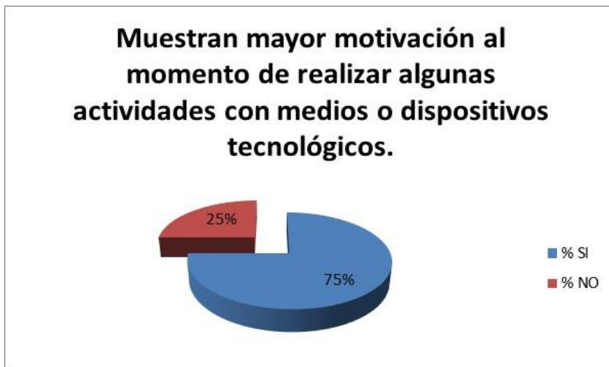
Gráfico N. 2 Motivación en actividades mediante el uso de las TIC