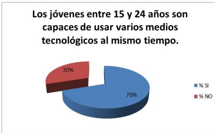
Gráfico N. 4 Capacidad de uso simultáneo de las TIC