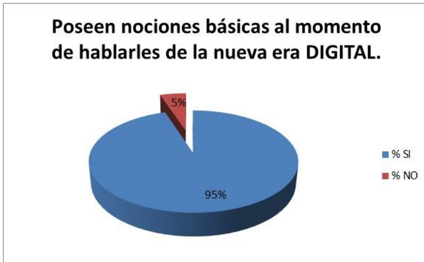
Gráfico N. 6 Conocimiento de la nueva era digital