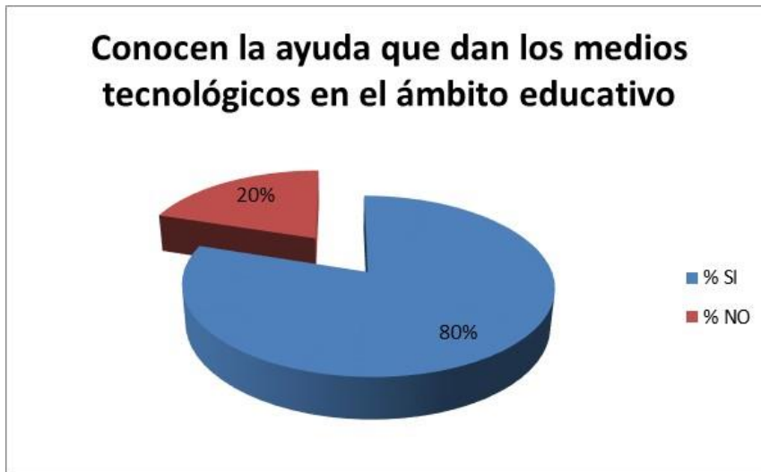
Gráfico N. 5 TIC y ámbito educativo

Fuente: Elaboración propia Autor: Mauricio Orozco