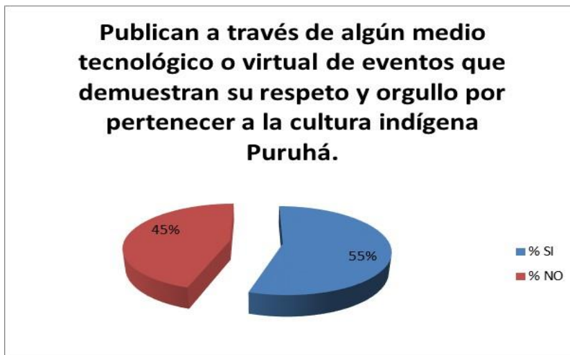
Gráfico N. 8 Publicación con las TIC del medio cultural