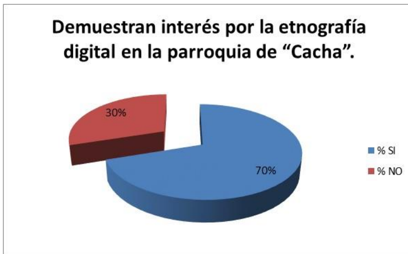
Gráfico N. 10 Interés por la Etnografía Digital