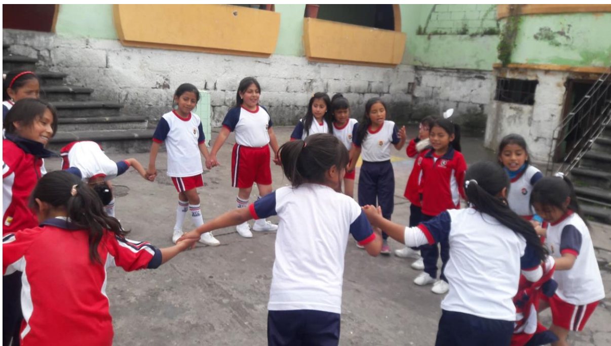
Fuente: Escuela de Educación General Básica “21 de Abril” Cuarto “A” Elaborado por: Johana Daquilema