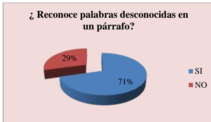
Gráfico 4: PALABRAS DESCONOCIDAS DE UN PARRAFO