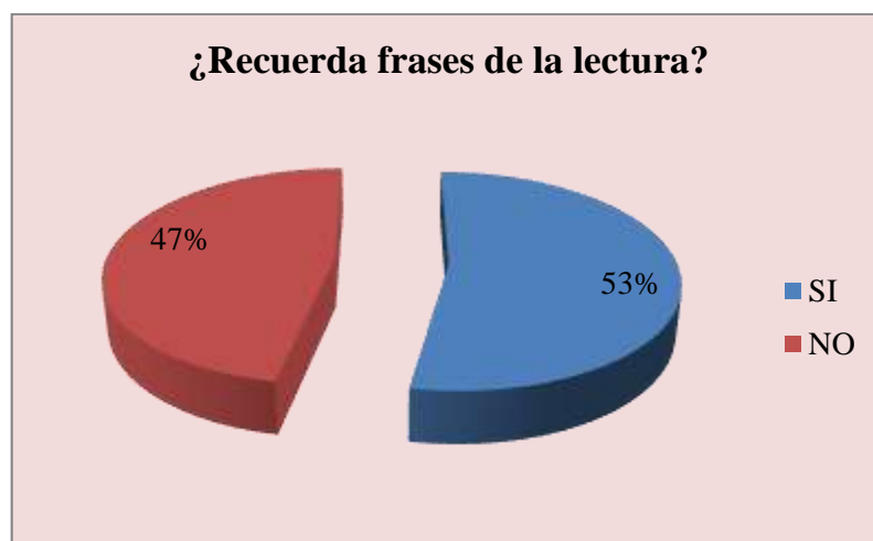
Gráfico 5: RECUERDA FRASES DE LA LECTURA