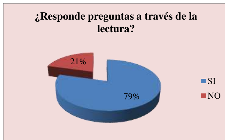
Gráfico 7: RESPONDE PREGUNTAS A TRAVÉS DE LA LECTURA

Fuente: Cuadro N° 7 Elaborado por: Jessica Vallejo