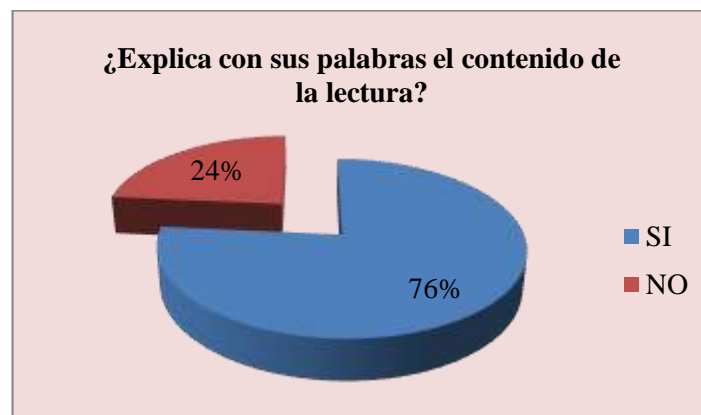
Gráfico 8. CONTENIDO DE LA LECTURA