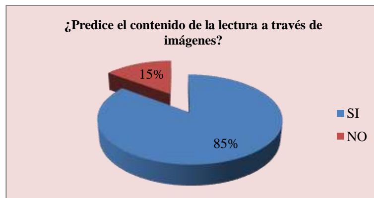
Gráfico 2: LECTURA A TRAVÉS DE IMÁGENES