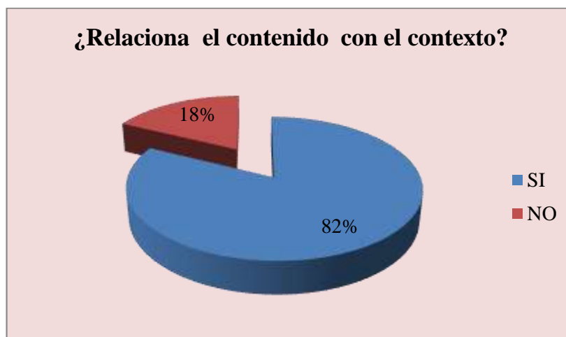
Gráfico 9: RELACIONA EL CONTENIDO CON EL CONTEXTO