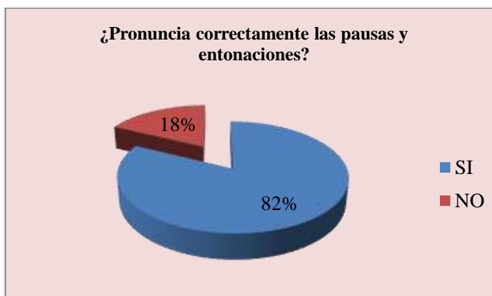
Gráfico 6: PRONUNCIA CORRECTAMENTE LAS PAUSAS Y ENTONACIONES