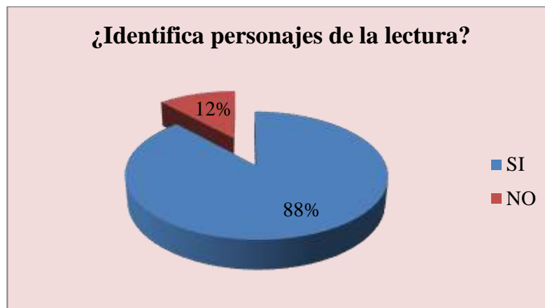
Gráfico 3: PERSONAJES DE LA LECTURA

Fuente: Cuadro N° 3 Elaborado por: Jessica Vallejo