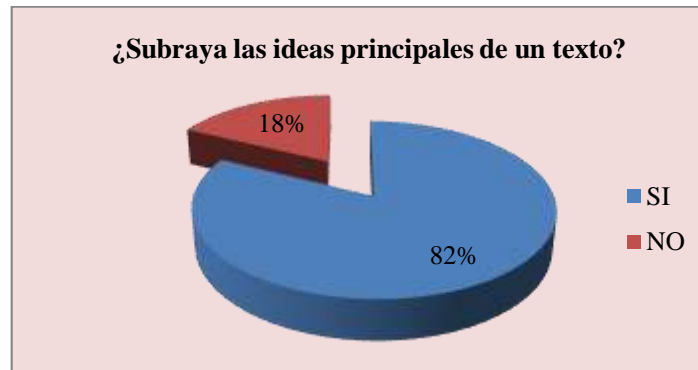
Gráfico 1: IDEAS PRINCIPALES DE UN TEXTO