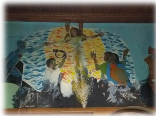
Figura 9 La Resurrección

El sexto cuadro es el de la resurrección de Cristo, pero también se hacen presentes otros elementos como una pirámide que identifica el poder político su idea era expresar que este tipo de poderes son efímeros, además que aun en la actualidad existen hombres crucificados por los poderes económicos, políticos que influyen en la sociedad.