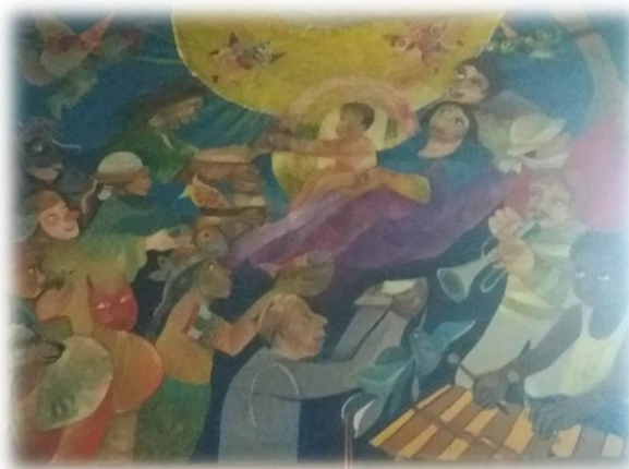
Figura 6 El Éxodo