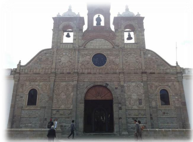
Figura 1 Fachada de la Iglesia de la Catedral