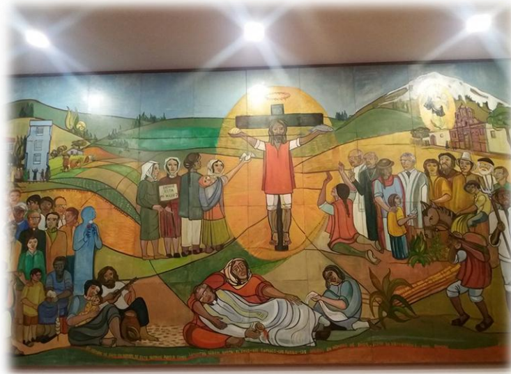
Figura 15 Mural Pueblos latinoamericanos, homenaje a Mons. Proaño