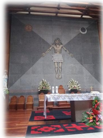
Figura 14 Mural Cristo resucitado