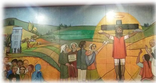
Figura 18 Cristo de poncho