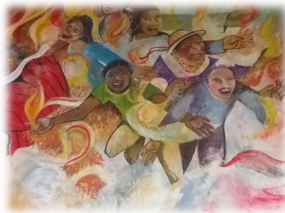
Figura 7 Festividades de la sociedad riobambeña