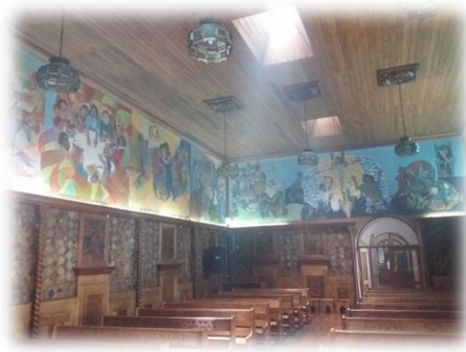
Figura 3 Mural historia de la Iglesia de Riobamba