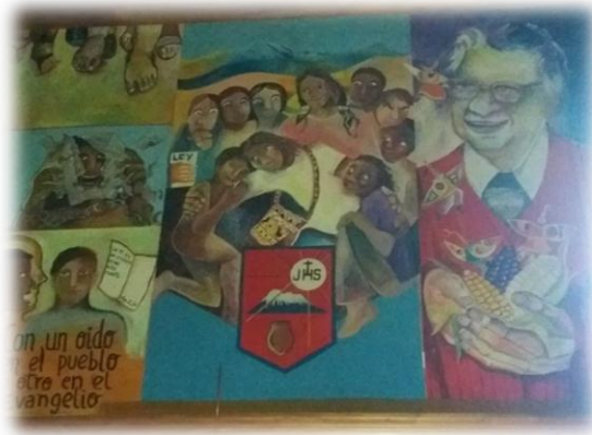
Figura 8 Monseñor Proaño y su compromiso

El quinto cuadro es el rostro de Monseñor Proaño que representa al hombre comprometido y fiel a sus sueños, además fue un pedido de Monseñor Corral realizar esta pintura ya que fue un ente de inspiración para las trasformaciones sociales. Aparte del rostro, se encuentra otro elemento, un hombre con un periódico roto que busca identificar que los medios no siempre dicen la verdad y que las personas deben romper con estas limitaciones.