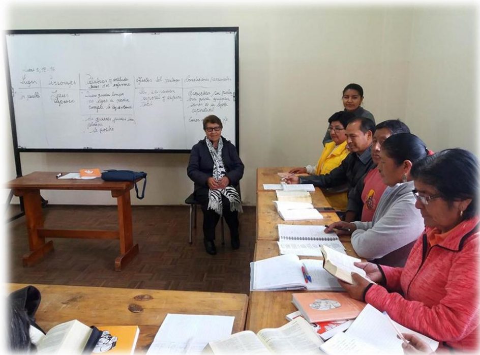
Fuente: Entrevista Pastoral de la Salud Tomado por: Katherine Elizabeth Dávila