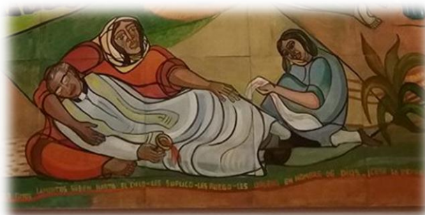
Fuente: Iglesia de la Catedral de Riobamba Tomado por: Katherine Elizabeth Dávila