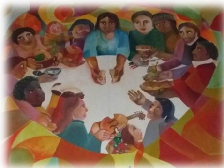
Figura 11 Pastoral Comunitaria

Fuente: Capilla de Santa Bárbara Tomado por: Katherine Elizabeth Dávila