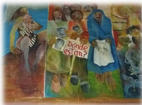
Figura 10 Donde están