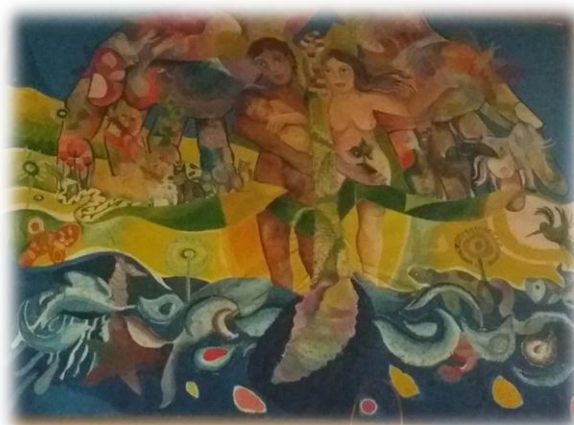
Figura 4 La Creación