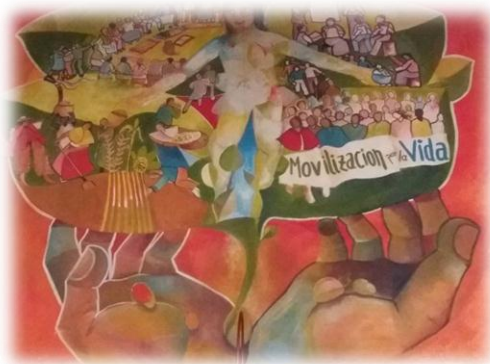
Figura 12 Movilización de la vida