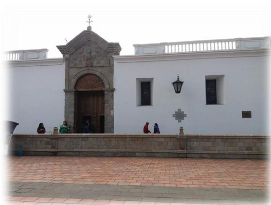
Figura 2 Capilla de Santa Bárbara