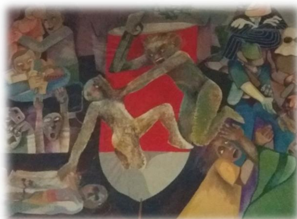
Figura 5 El Mal