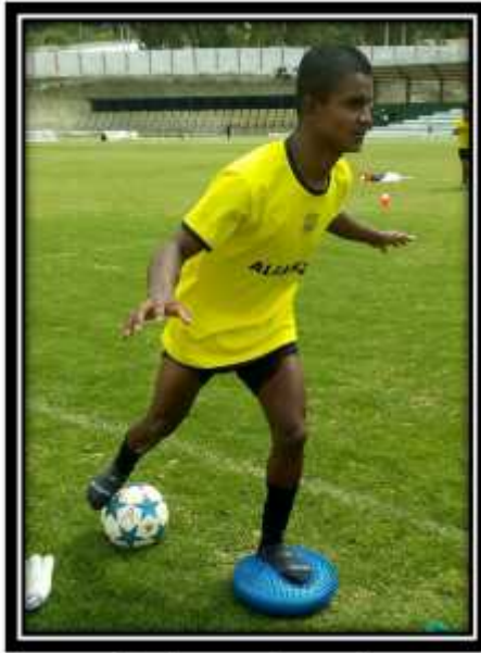
Fotografía N° 8 Entrenamiento propioceptivo cenestésico, equilibrio y saltos con pelota en plataforma inestable con apoyo unipodal

Fuente: Club Formativo Especializado Alianza Autor: Jaime Gutiérrez, Marzo – Agosto 2017