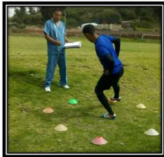
Fotografía N° 7 Valoración del equilibrio estático con test estrella elaborada con conos tortuga

Fuente: Club Formativo Especializado Alianza Autor: Jaime Gutiérrez, Marzo – Agosto 2017