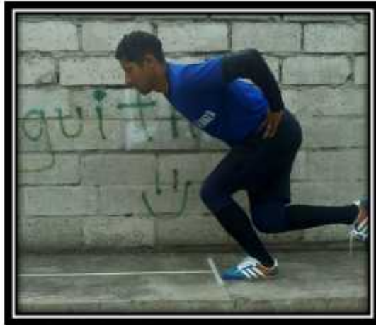
Fotografía N° 6 Valoración del salto horizontal unipodal plataforma elaborada con cinta adhesiva