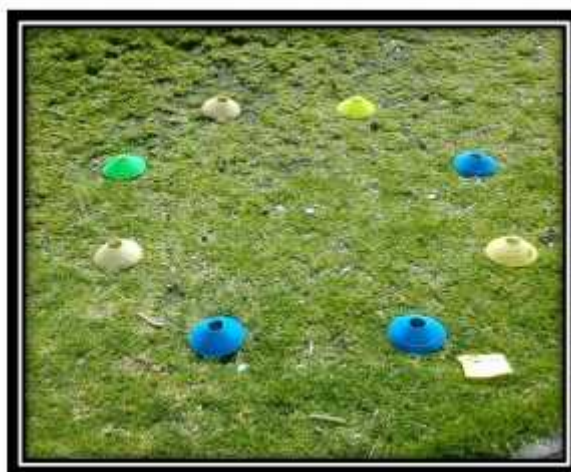
Fotografía N° 5 Test estrella elaborada con conos tortuga para valorar el equilibrio estático.

Fuente: Club Formativo Especializado Alianza Autor: Jaime Gutiérrez, Marzo – Agosto 2017