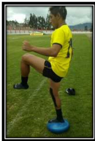
Fotografía N° 9 Entrenamiento propioceptivo cenestésico, equilibrio y saltos con pelota en plataforma inestable con apoyo unipodal

Fuente: Club Formativo Especializado Alianza Autor: Jaime Gutiérrez, Marzo – Agosto 2017