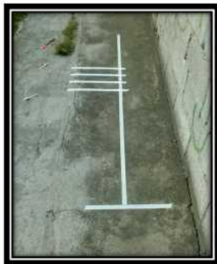
Fotografía N° 4 Plataforma elaborada con cinta adhesiva para valorar el salto horizontal unipodal

Marzo – Agosto 2017