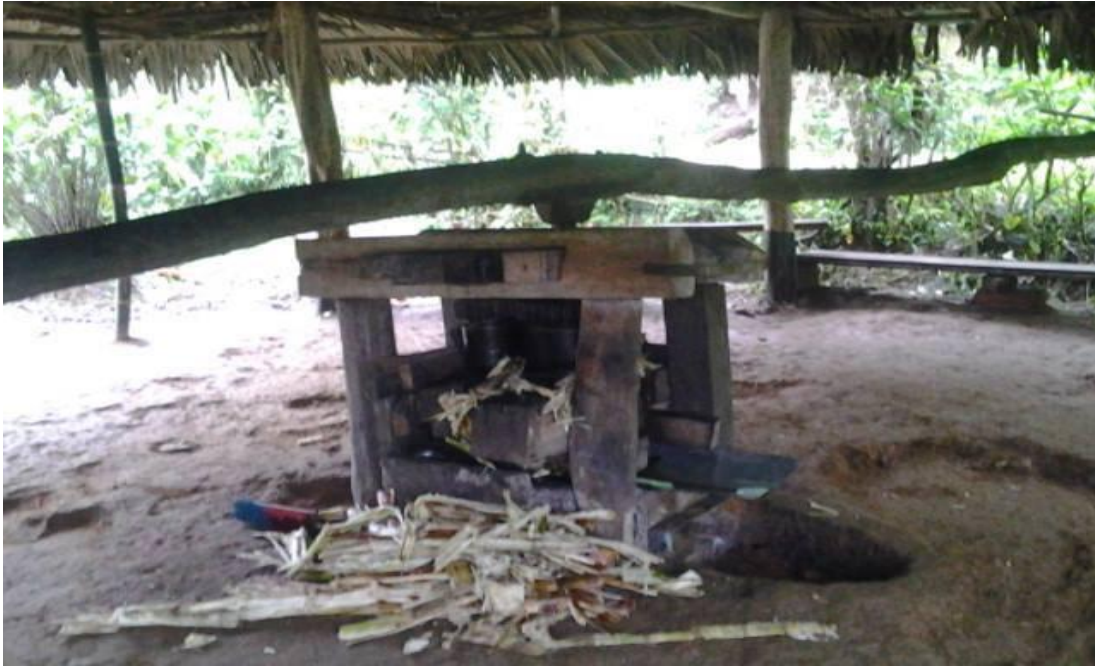
Fotografía: Trapiche ubicado en el sector rural del cantón Gral. Elizalde (Bucay) Elaborado por: Verónica Sampedro