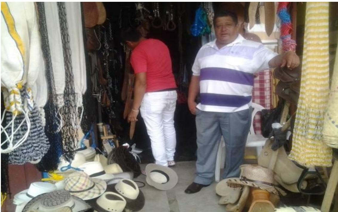
Fotografía: Vendedor de sombreros, hamacas y machetes, ubicado en el centro de Bucay Elaborado por: Verónica Sampedro