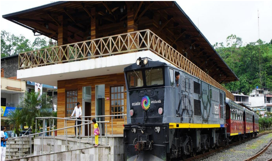
Fotografía: Estación del tren cantón Gral. Elizalde Bucay. Elaborado por: Verónica Sampedro.