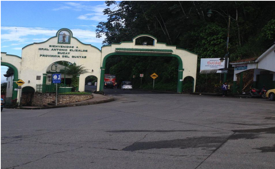
Fotografía: Arcos de entrada a la cabecera cantonal de Gral. Antoni Elizalde (Bucay). Elaborado por: Verónica Sampedro