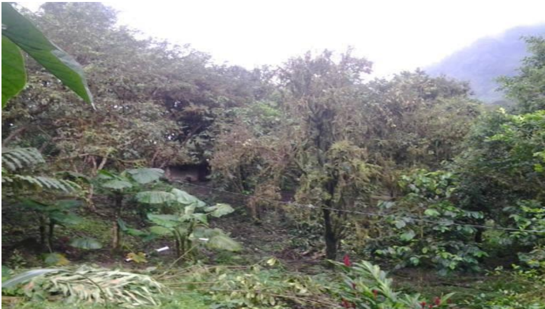
Fotografía: Paisaje del sector rural del cantón Gral. Elizalde (Bucay)