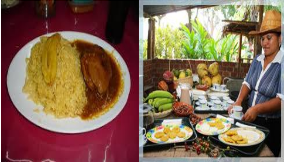
Fotografía: Comidas típicas del cantón Bucay. Elaborado por: Verónica Sampedro