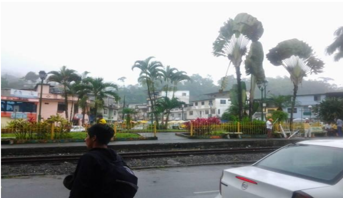
Fotografía: Parque Central del GAD de Bucay Gral. Antonio Elizalde Elaborado por: Verónica Sampedro