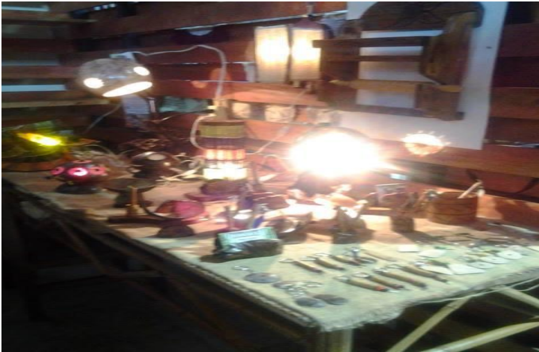
Fotografía: Taller de artesanías de material en madera y coco, ubicado en el centro de Bucay.