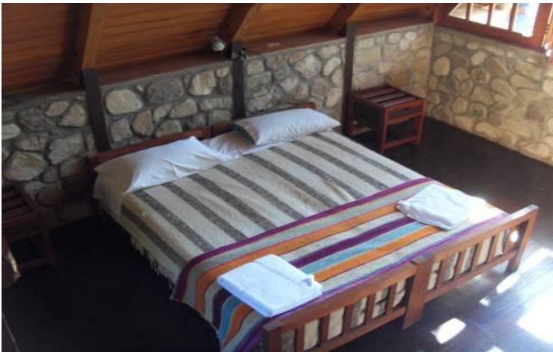
Fotografía: Habitación del hotel El Rey, ubicado en el sector urbano del cantón Gral. Elizalde (Bucay) Elaborado por: Verónica Sampedro