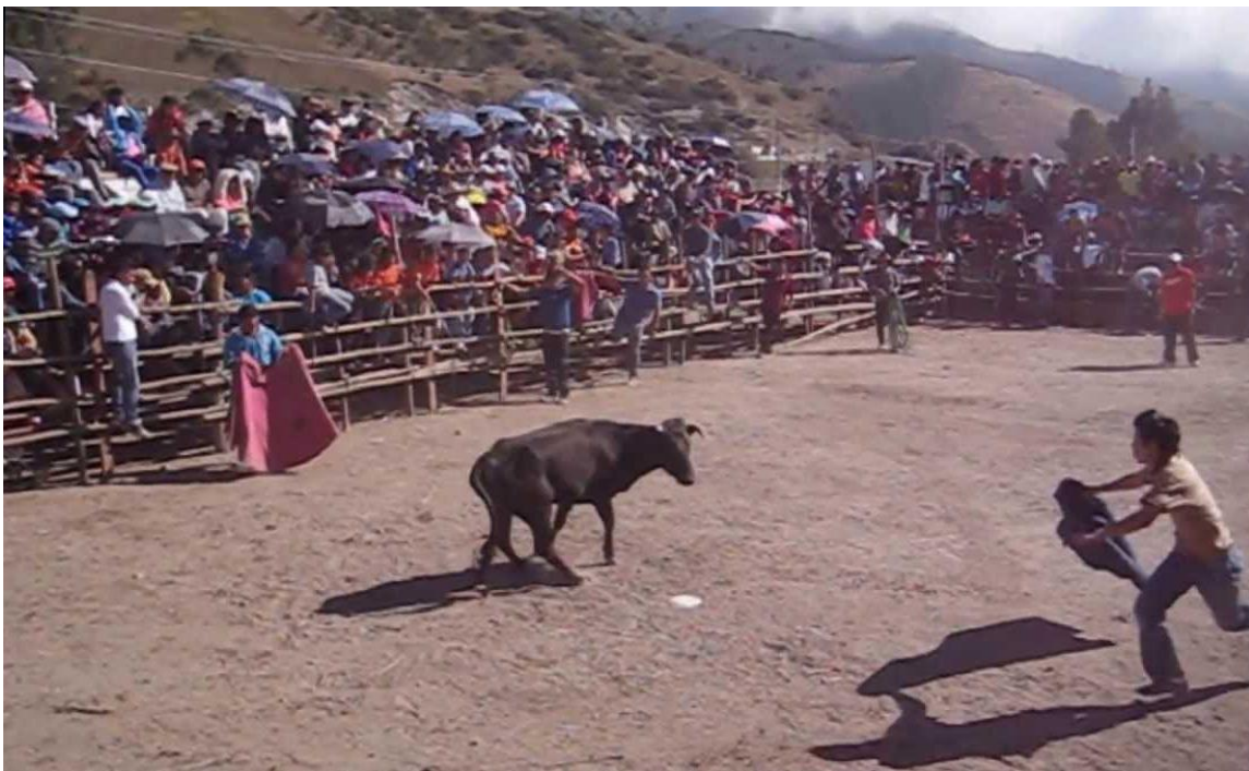
Fotografía: Corrida de toros por las fiestas de cantonización del cantón Bucay Elaborado por: Verónica Sampedro