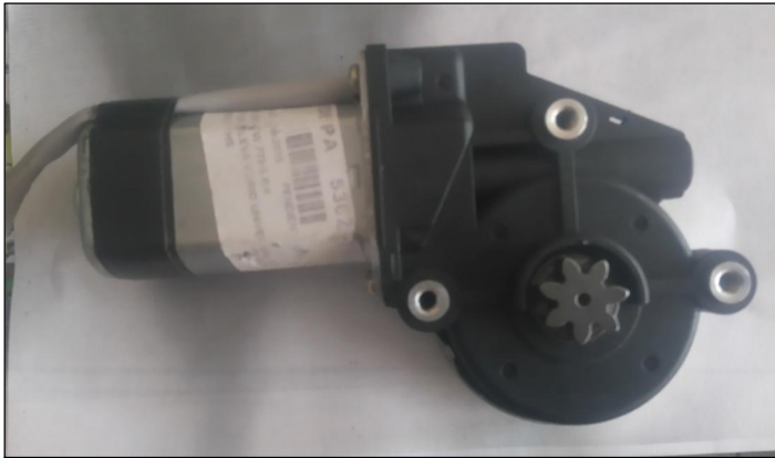
MOTOR BASE INFERIOR