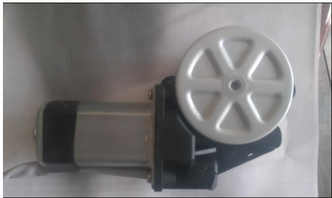
MOTOR BASE SUPERIOR