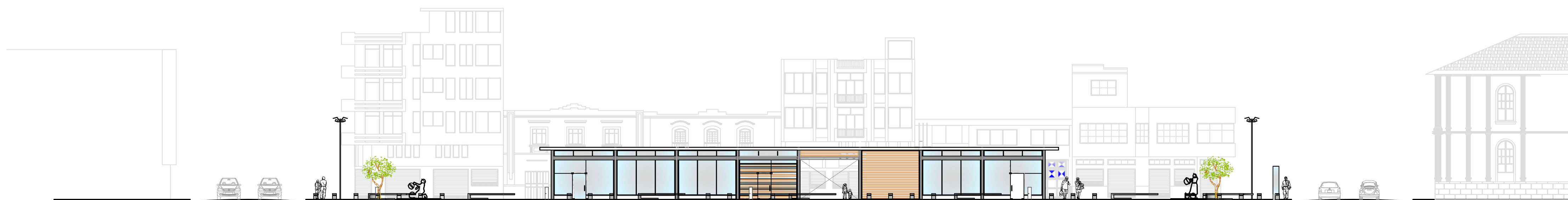
4. ALZADO CALLE 5 DE JUNIO Escala: 1:200