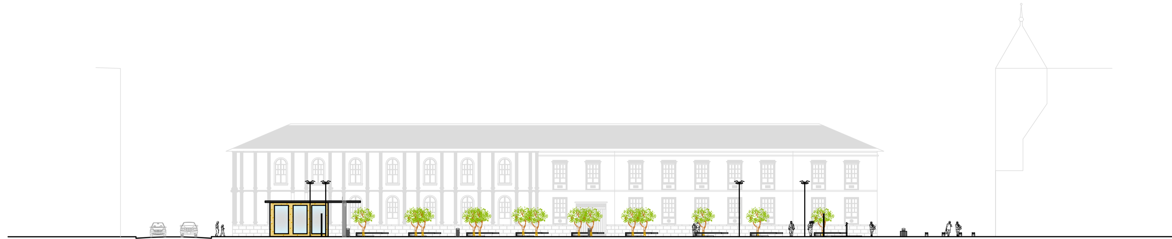
2. ALZADO CALLE JUNÍN Escala: 1:200