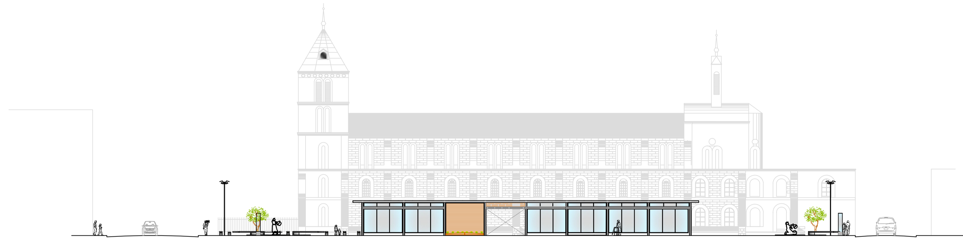
1. ALZADO CALLE TARQUI Escala: 1:200