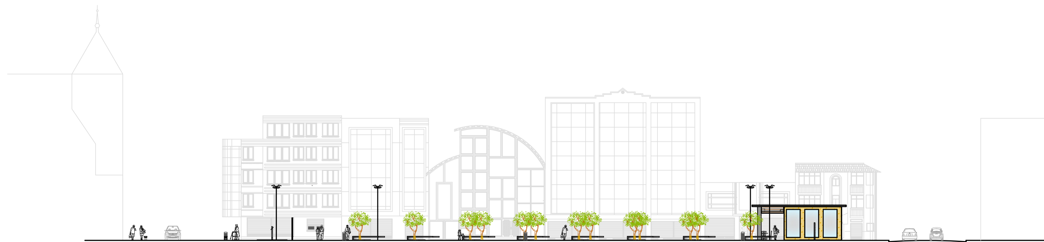
3. ALZADO CALLE ARGENTINOS Escala: 1:200