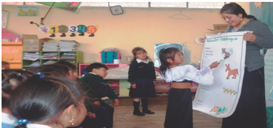
Fuente: Niños del C.E.I. Glenda Alcívar /Elaborado: Lic. Olga Lema.

A diferencia de las conversaciones espontáneas, en estas situaciones los estudiantes necesitan reflexionar previamente sobre el contenido de su relato y sobre la forma en que lo van a presentar.