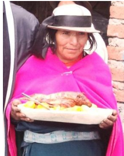
Fuente: Personaje de la comunidad Gatazo / Elaborado: Lic. Olga Lema.