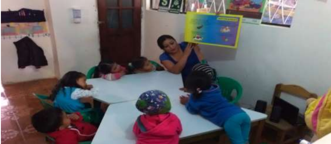
Descripción: niños trabajando con adivinanzas