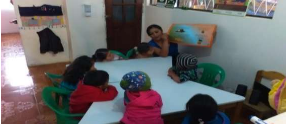
Descripción: niños trabajando con retahílas