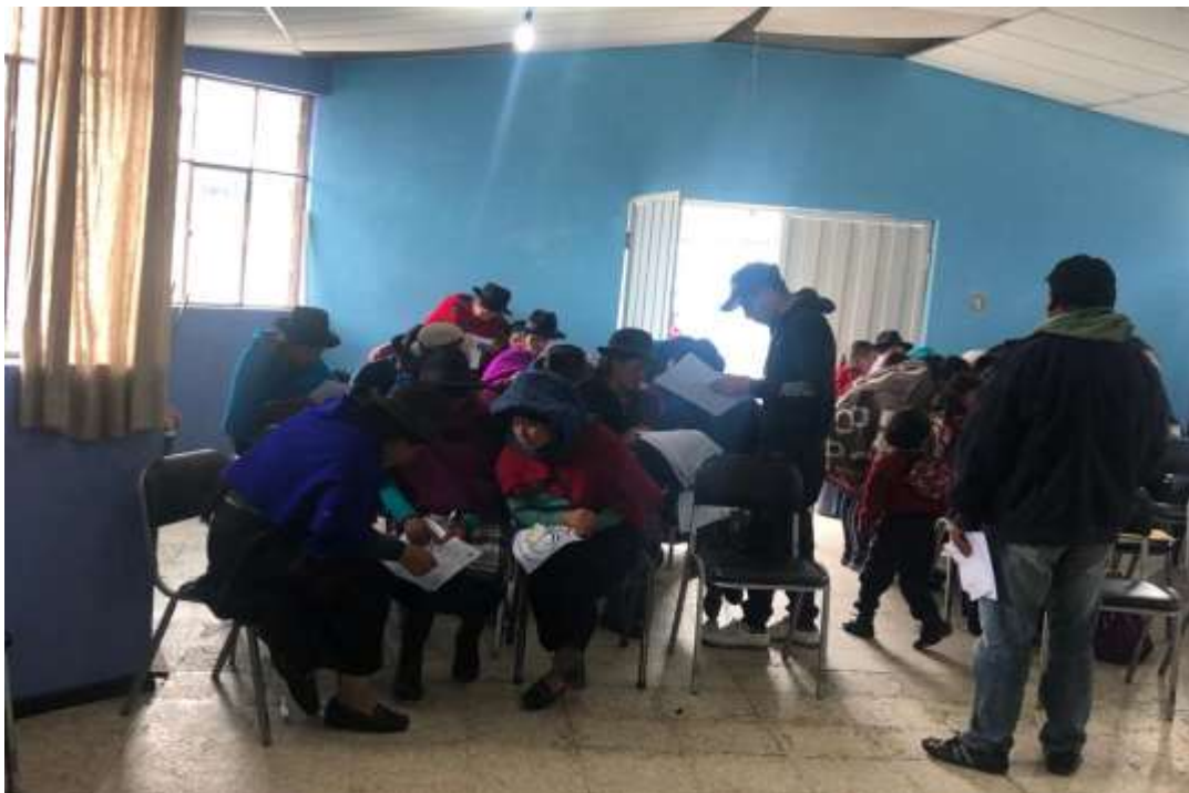
Nota: Padres de familia de la Unidad Educativa Sicalpa. Elaborado por: Jeniffer Meliza Panata Punina