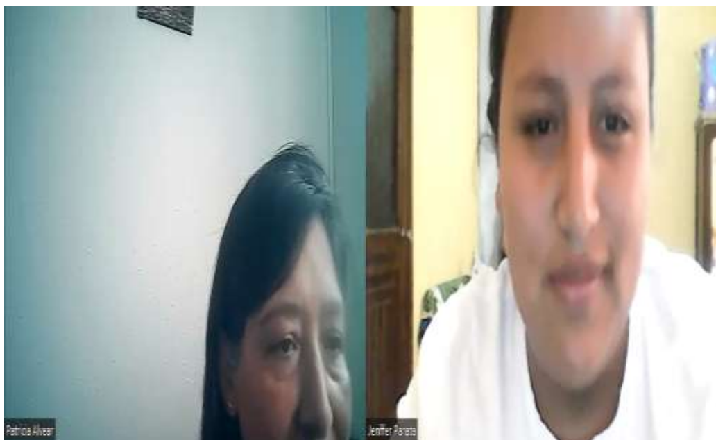
Imagen 6: Entrevista a expertos