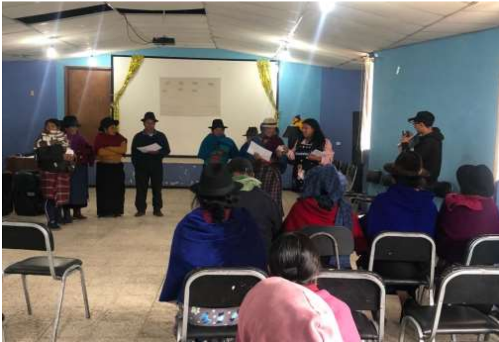
Imagen 10: Taller Educando En Familia.

Nota: Padres de familia de la Unidad Educativa Sicalpa.