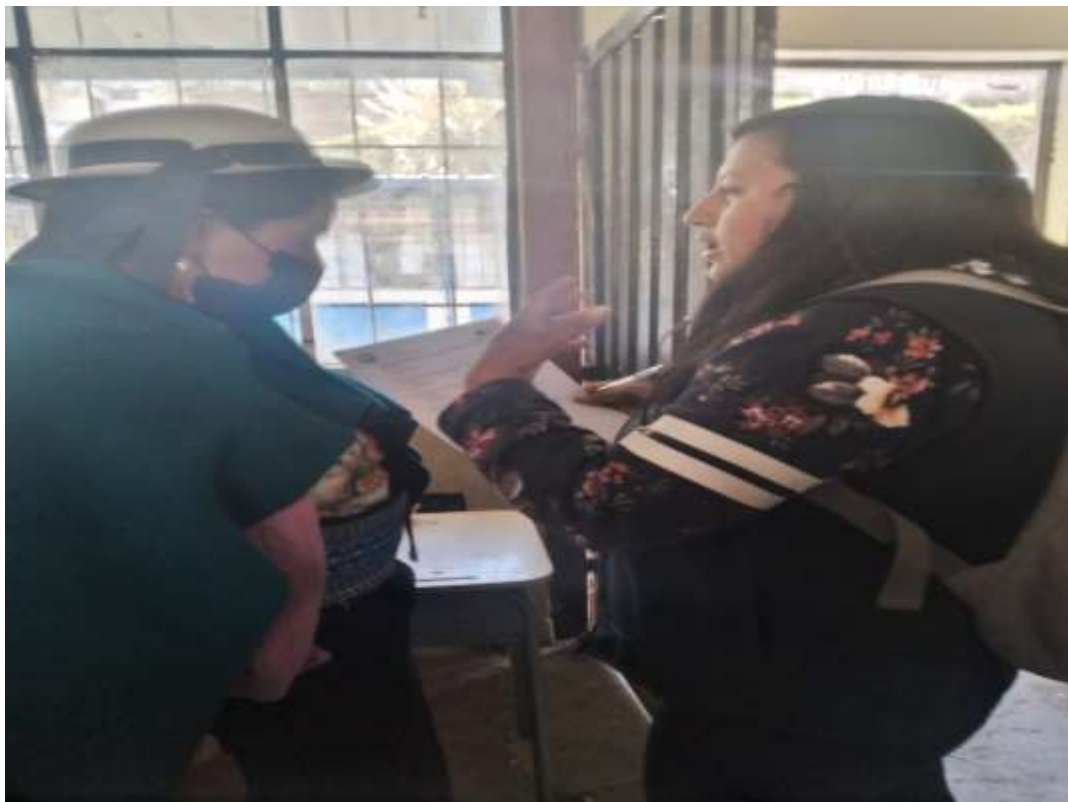
Imagen 9: Aplicación de la encuesta en la Unidad Educativa Sicalpa Primera Medición.

Nota: Padres de familia de la Unidad Educativa Sicalpa.