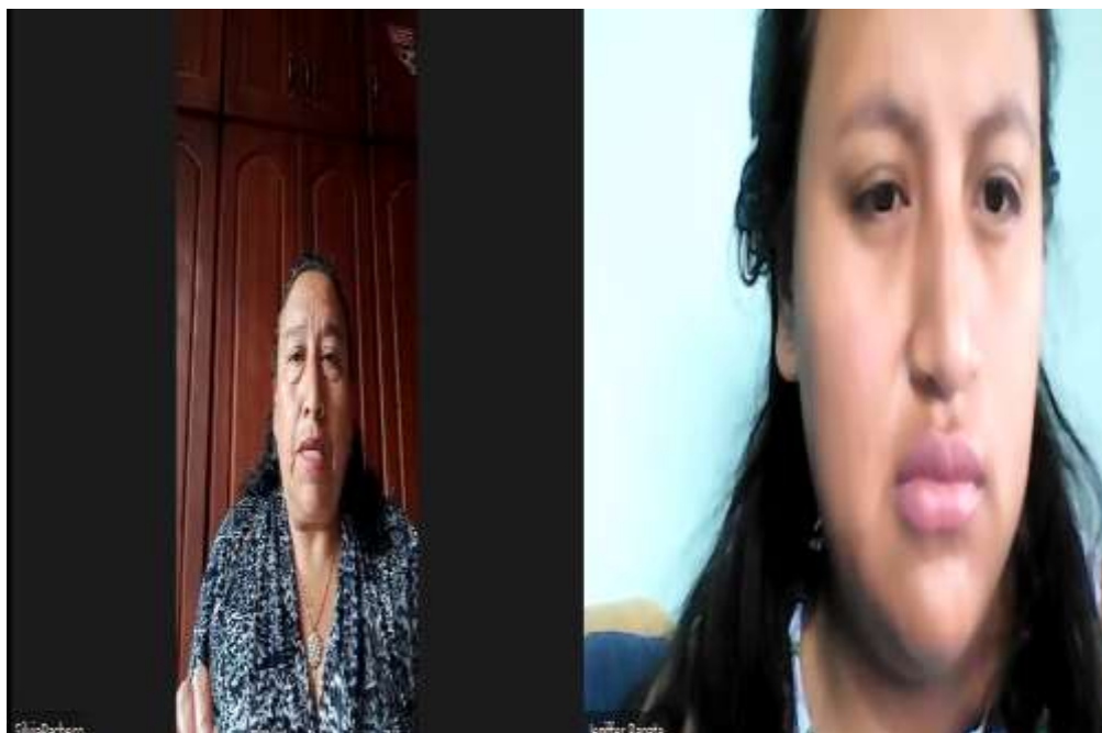
Imagen 7: Entrevista a expertos