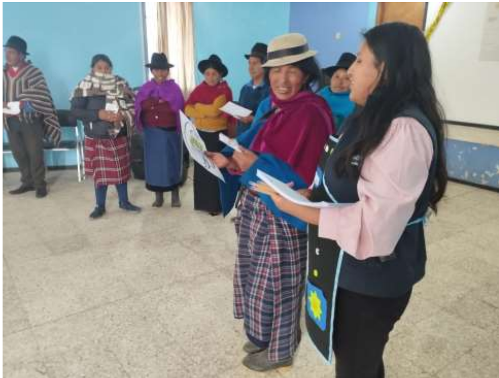
Imagen 11: Taller Educando En Familia.

Nota: Padres de familia de la Unidad Educativa Sicalpa.