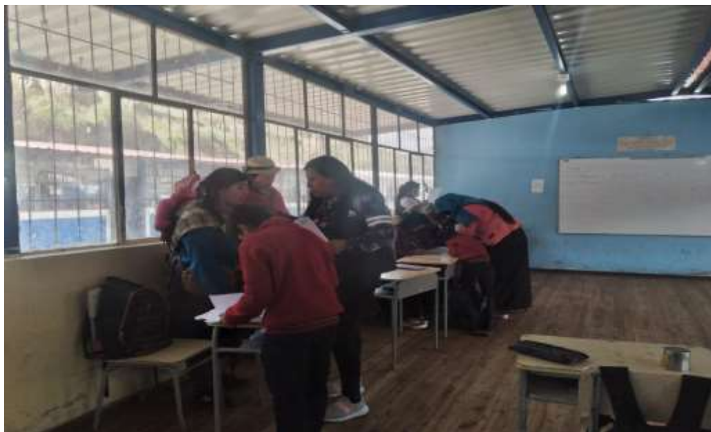
Imagen 8: Aplicación de la encuesta en la Unidad Educativa Sicalpa Primera Medición.

Nota: Padres de familia de la Unidad Educativa Sicalpa.