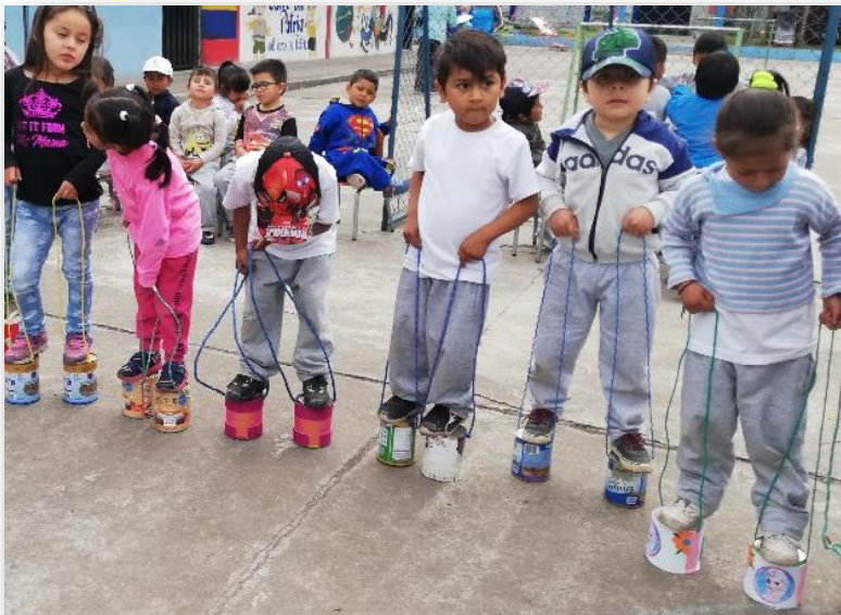
Imagen 12 Juego de zancos