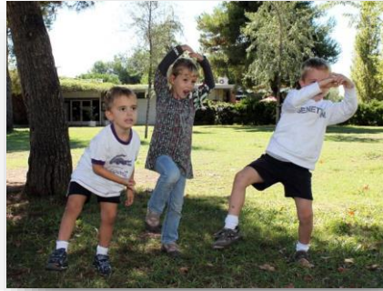
Imagen 1 Juego de las estatuas