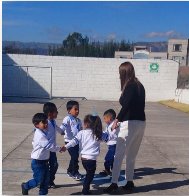
Imagen 10 Juego del gato y el raton