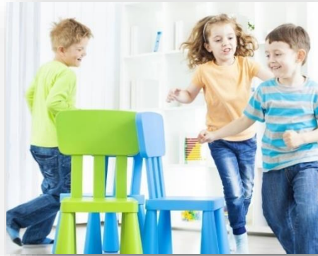
Imagen 5 Juego baile de la silla

Según (Bañeres, 2008) es un juego popular o tradicional , son aquellos juegos que hacen muchos años que se juega, a los que ya jugaban nuestros abuelos y que casi no han cambiado . se transmiten de generación en generación . cuando es necesario el objetivo material que utilizamos para desarrollar el juego lo contribuyen los propios jugadores , normalmente con objetos de la naturaleza o materiales comunes, estos pueden ser reciclados , no tienen reglas fijas , intervienen el consenso entre las personas que jugaran a la una hora definida existiendo una extensión temporal y espacial , así como los objetivos del juego (pg116).