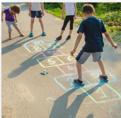
Imagen 3 JUEGO DE LA RAYUELA