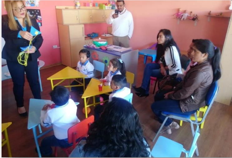
Imagen 9 Charla sobre los juegos tradicionales