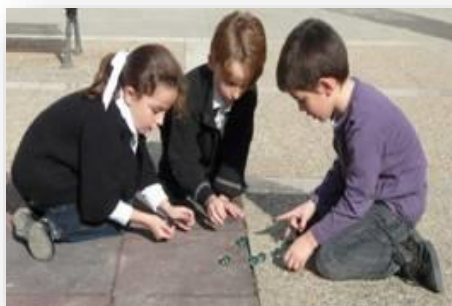
Imagen 4 Juego de las canicas