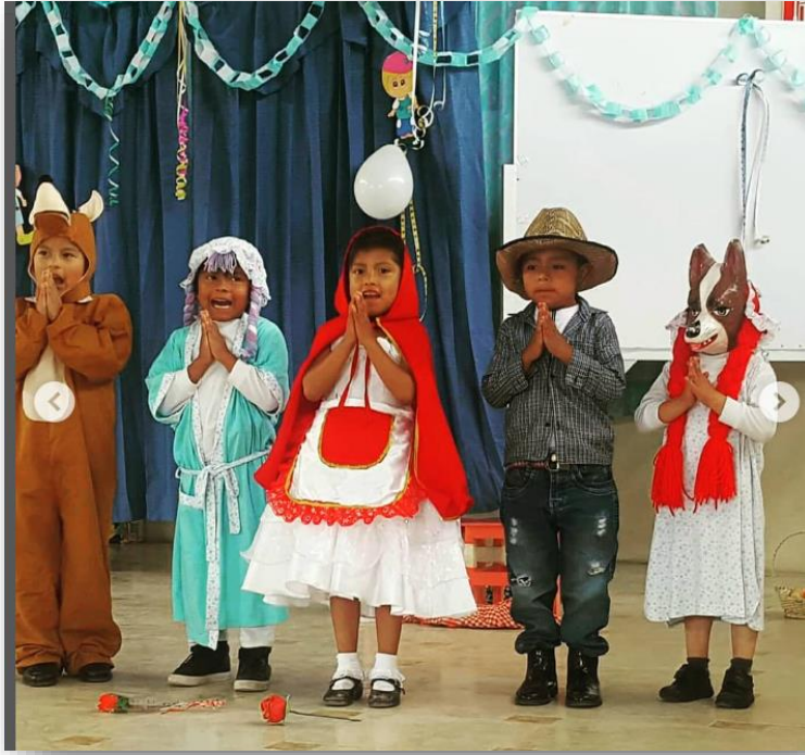
Imagen 11 Dramatización de cuentos