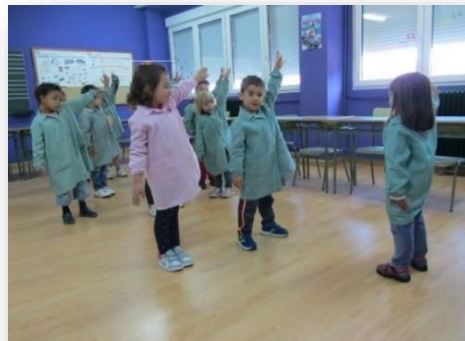
Imagen 2 Juego del espejo