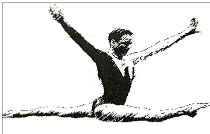
Gráfico 1. Split