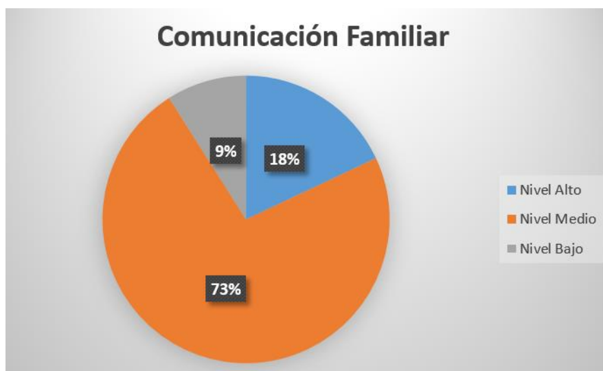
Figura 1 Comunicación Familiar