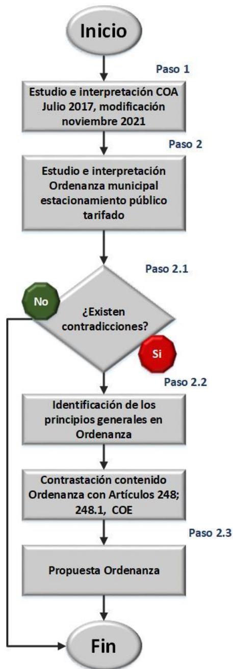
Figura 1. Diseño de la investigación

Los resultados de la investigación, parten de diseño mostrado en la Figura 1., donde se explica la herramienta AS / TO BE como instrumento administrativo a la hora de analizar legislaciones y ordenanzas locales.