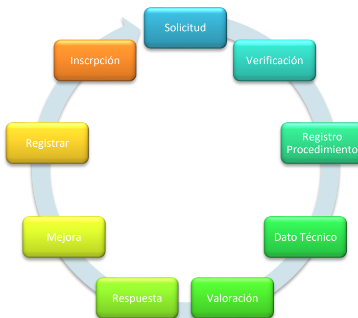
Figura 1-2: Proceso de la adjudicación